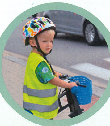
Správné vidění zdravých očí