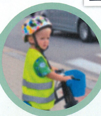
Špatné vidění při dioptrické vadě